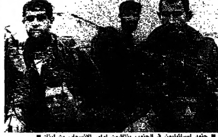
جنود اسرائيليون في الجنوب ينتظرون اوامر الانسحاب من لبنان

الاجلاس الامن في العاصمة والجبل والاقليم لا تزال تترجم تجسرات متلاحقة على الارض معطلة مجالات العمل لمواجهة استحقاق الانسحاب المرحلي الاسرائيلي من الجنوب. في الوقت الذي أعلن فيه مساعد الامن العام للامم المتحدة بريان اوركهارت عن تسلامه ازاء فرص التمسك مع اسرائيل في الجنوب.